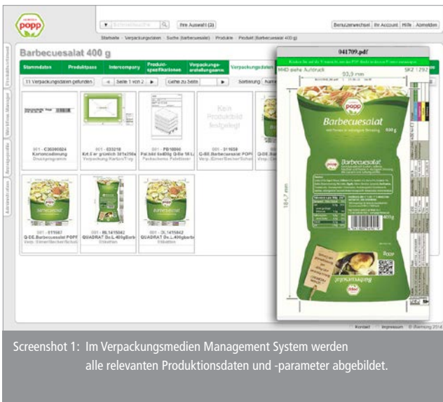
Screenshot 1: Im Verpackungsmedien Management System werden alle relevanten Produktionsdaten und -parameter abgebildet.

Die Dokumentenflut, die hinter der Lebensmittel- und Verpackungs-mittelproduktion steht, um beste und reinste Produkte anzubieten, ist womöglich noch komplexer zu verwalten als die zahlreichen